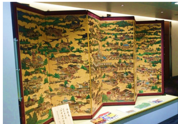
高精細複製「伝匠美」による 「洛中洛外図屏風」