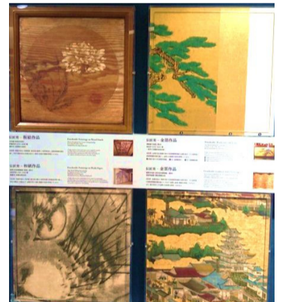
高精細複製「伝匠美」を 触れる展示