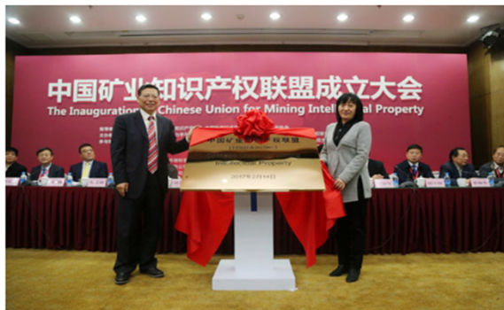
中国矿业知识产权联盟成立 我局开展专项專利導航服務