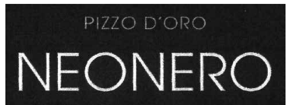
図6 本件の被疑侵害行為及びY社標章